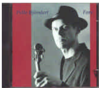
Titel: Fors Artist: Pelle Björnlert GCD-57